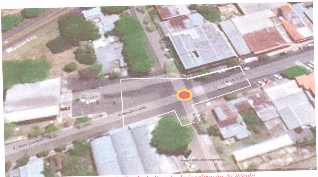
Indicação da localização da Rótula.

A cidade é uma porta de entrada do Brasil e do Mercosul, portanto, é merecedora de um ponto onde a alusão a tríplice fronteira fique evidente para quem aqui passar.